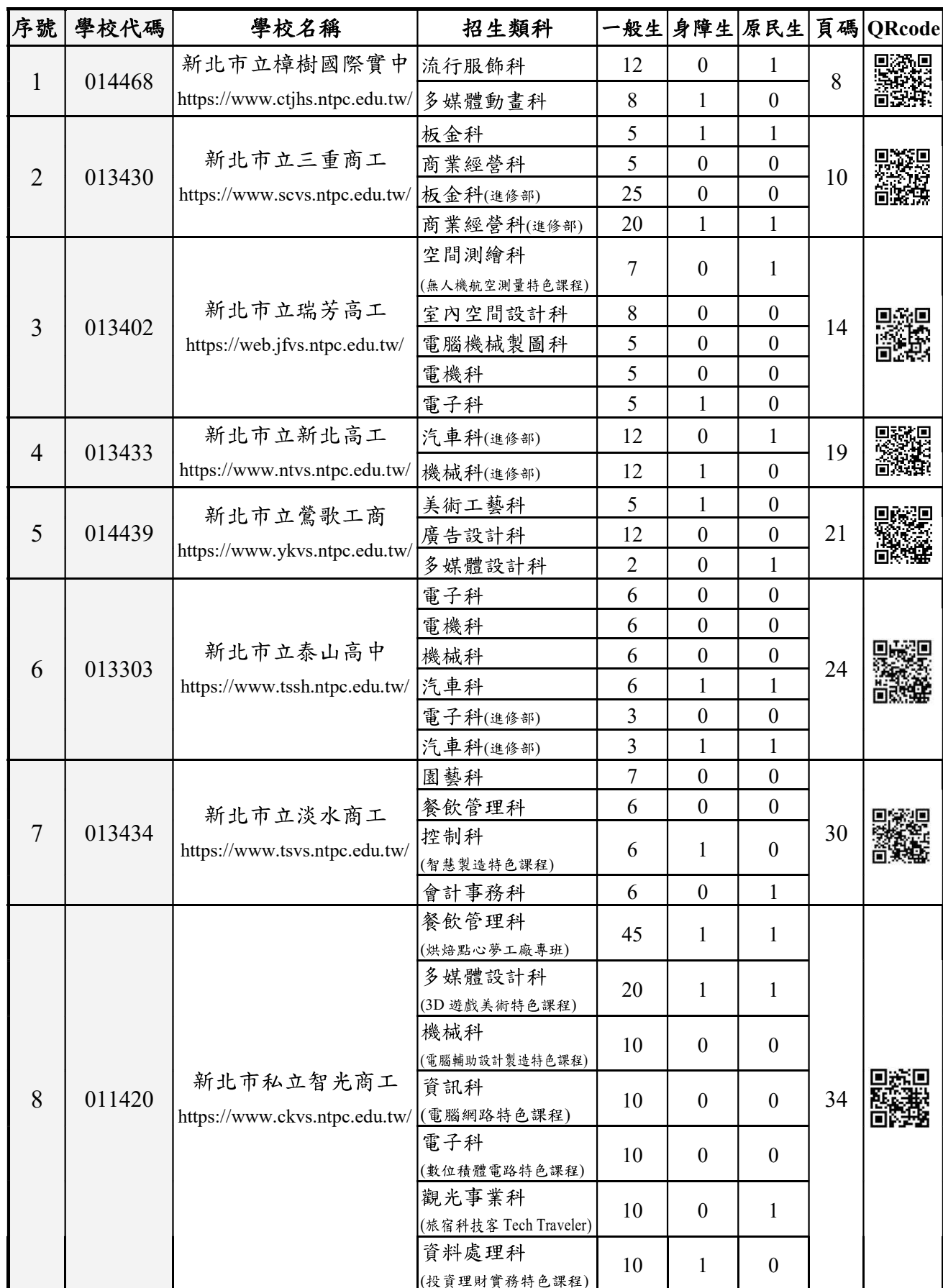
115 學年度新北市高級中等學校特色招生專業群科甄選入學招生學校一覽表